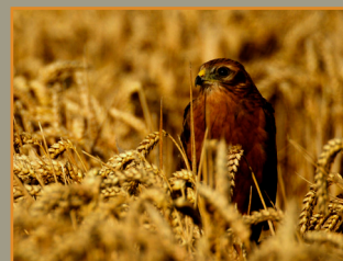
Jeune busard cendré