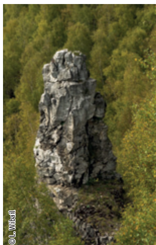
Rocher calcaire (Réserve Naturelle de Sclaigneaux)