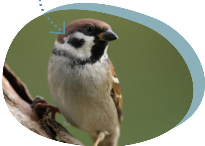
mâle et femelle

Il existe deux espèces de moineaux dans nos campagnes. Ils se ressemblent.