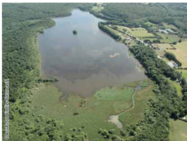
Étang de Virelles

Un habitat Natura 2000 est un milieu rare, menacé ou remarquable à l'échelle européenne. En Wallonie, ces habitats sont regroupés en unités de gestion (UG) nécessitant des mesures 1 pour les maintenir dans un état de conservation favorable. La liste des principaux habitats Natura 2000 présents dans ce site sont: