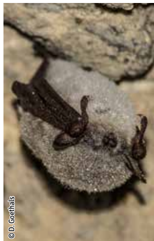
Vespertilion des marais

Une espèce Natura 2000 est une espèce en danger d'extinction, vulnérable, rare ou dont la répartition géographique est restreinte à l'échelle européenne. La liste des principales espèces Natura 2000 présentes dans ce site sont: