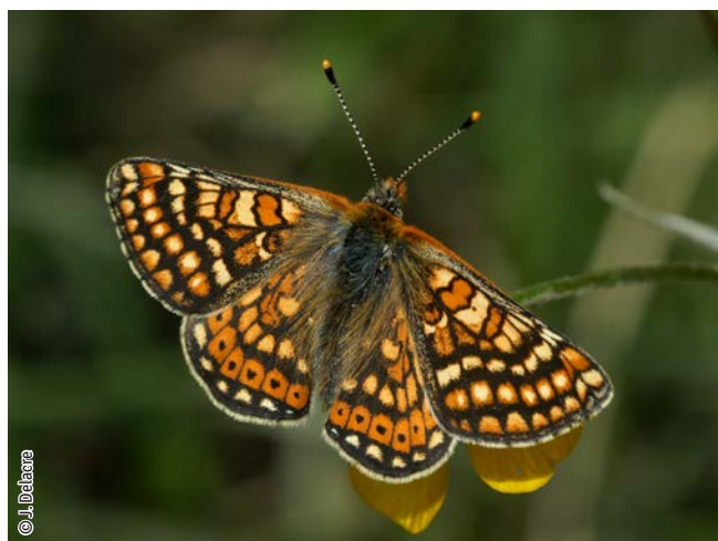
Damier de la succise

Une espèce Natura 2000 est une espèce en danger d'extinction, vulnérable, rare ou dont la répartition géographique est restreinte à l'échelle européenne. La liste des principales espèces Natura 2000 présentes dans ce site sont :