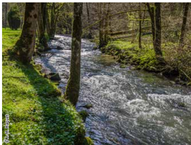
Le Bocq et ses versants boisés

Un habitat Natura 2000 est un milieu rare, menacé ou remarquable à l'échelle européenne. En Wallonie, ces habitats sont regroupés en unités de gestion (UG) nécessitant des mesures 1 pour les maintenir dans un état de conservation favorable. La liste des principaux habitats Natura 2000 présents dans ce site sont :