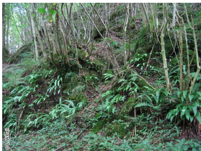
Forêt de pente

Un habitat Natura 2000 est un milieu rare, menacé ou remarquable à l'échelle européenne. En Wallonie, ces habitats sont regroupés en unités de gestion (UG) nécessitant des mesures 1 pour les maintenir dans un état de conservation favorable. La liste des principaux habitats Natura 2000 présents dans ce site sont :