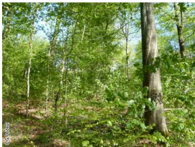
Hêtre à aspérule

Un habitat Natura 2000 est un milieu rare, menacé ou remarquable à l'échelle européenne. En Wallonie, ces habitats sont regroupés en unités de gestion (UG) nécessitant des mesures 1 pour les maintenir dans un état de conservation favorable. La liste des principaux habitats Natura 2000 présents dans ce site sont: