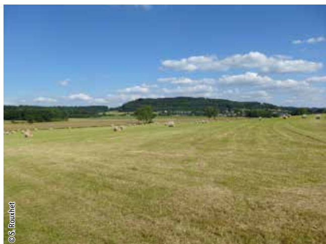
Prairie de fauche - Plaine d'inondation du Schiewerbach, Turpange

Un habitat Natura 2000 est un milieu rare, menacé ou remarquable à l'échelle européenne. En Wallonie, ces habitats sont regroupés en unités de gestion (UG) nécessitant des mesures 1 pour les maintenir dans un état de conservation favorable. La liste des principaux habitats Natura 2000 présents dans ce site sont: