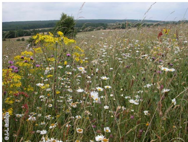
Prairie de fauche de moyenne altitude

Un habitat Natura 2000 est un milieu rare, menacé ou remarquable à l'échelle européenne. En Wallonie, ces habitats sont regroupés en unités de gestion (UG) nécessitant des mesures 1 pour les maintenir dans un état de conservation favorable. La liste des principaux habitats Natura 2000 présents dans ce site sont :