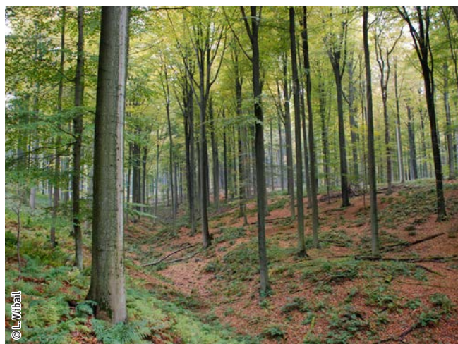
Hêtraie à luzule

Un habitat Natura 2000 est un milieu rare, menacé ou remarquable à l'échelle européenne. En Wallonie, ces habitats sont regroupés en unités de gestion (UG) nécessitant des mesures 1 pour les maintenir dans un état de conservation favorable. La liste des principaux habitats Natura 2000 présents dans ce site sont: