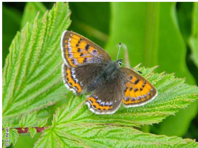
Cuivré de la bistorte

Une espèce Natura 2000 est une espèce en danger d'extinction, vulnérable, rare ou dont la répartition géographique est restreinte à l'échelle européenne. La liste des principales espèces Natura 2000 présentes dans ce site sont: