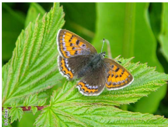
Cuivré de la bistorte

Une espèce Natura 2000 est une espèce en danger d'extinction, vulnérable, rare ou dont la répartition géographique est restreinte à l'échelle européenne. La liste des principales espèces Natura 2000 présentes dans ce site sont: