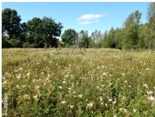
Prairie humide à végétation haute

Un habitat Natura 2000 est un milieu rare, menacé ou remarquable à l'échelle européenne. En Wallonie, ces habitats sont regroupés en unités de gestion (UG) nécessitant des mesures 1 pour les maintenir dans un état de conservation favorable. La liste des principaux habitats Natura 2000 présents dans ce site sont :