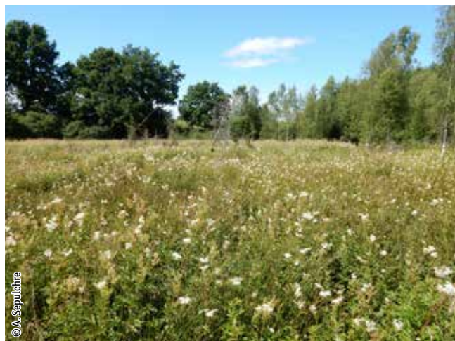
Prairie humide à végétation haute

Un habitat Natura 2000 est un milieu rare, menacé ou remarquable à l'échelle européenne. En Wallonie, ces habitats sont regroupés en unités de gestion (UG) nécessitant des mesures 1 pour les maintenir dans un état de conservation favorable. La liste des principaux habitats Natura 2000 présents dans ce site sont: