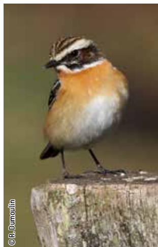
Tarier des prés

Une espèce Natura 2000 est une espèce en danger d'extinction, vulnérable, rare ou dont la répartition géographique est restreinte à l'échelle européenne. La liste des principales espèces Natura 2000 présentes dans ce site sont: