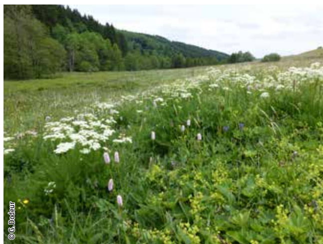
Prairie de fauche de montagne

Un habitat Natura 2000 est un milieu rare, menacé ou remarquable à l'échelle européenne. En Wallonie, ces habitats sont regroupés en unités de gestion (UG) nécessitant des mesures 1 pour les maintenir dans un état de conservation favorable. La liste des principaux habitats Natura 2000 présents dans ce site sont: