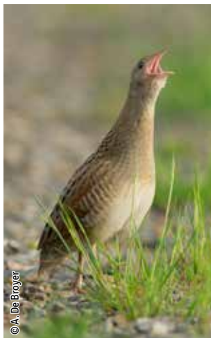
Râle des genêts