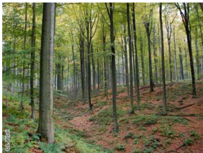
Hêtraie à luzule

Un habitat Natura 2000 est un milieu rare, menacé ou remarquable à l'échelle européenne. En Wallonie, ces habitats sont regroupés en unités de gestion (UG) nécessitant des mesures 1 pour les maintenir dans un état de conservation favorable. La liste des principaux habitats Natura 2000 présents dans ce site sont: