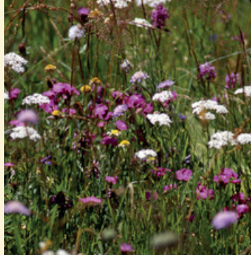
Bande fleurie - MC7