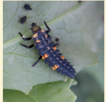
Larve de coccinelle

Les pesticides ont des effets néfastes directs et indirects sur les auxiliaires.