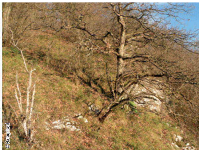
Forêts de pente

Un habitat Natura 2000 est un milieu rare, menacé ou remarquable à l'échelle européenne. En Wallonie, ces habitats sont regroupés en unités de gestion (UG) nécessitant des mesures 1 pour les maintenir dans un état de conservation favorable. La liste des principaux habitats Natura 2000 présents dans ce site sont :