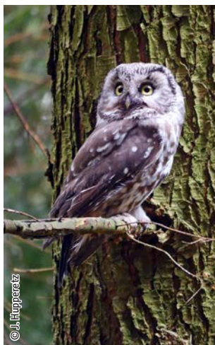
Chouette de Tengmalm