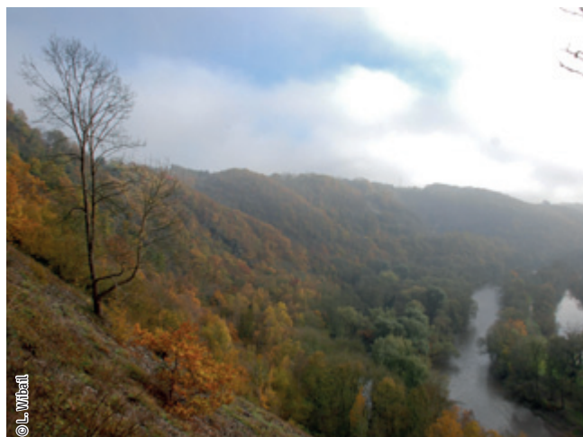
Forêt de pente (Éboulis Montfort)

Un habitat Natura 2000 est un milieu rare, menacé ou remarquable à l'échelle européenne. En Wallonie, ces habitats sont regroupés en unités de gestion (UG) nécessitant des mesures 1 pour les maintenir dans un état de conservation favorable. La liste des principaux habitats Natura 2000 présents dans ce site sont :